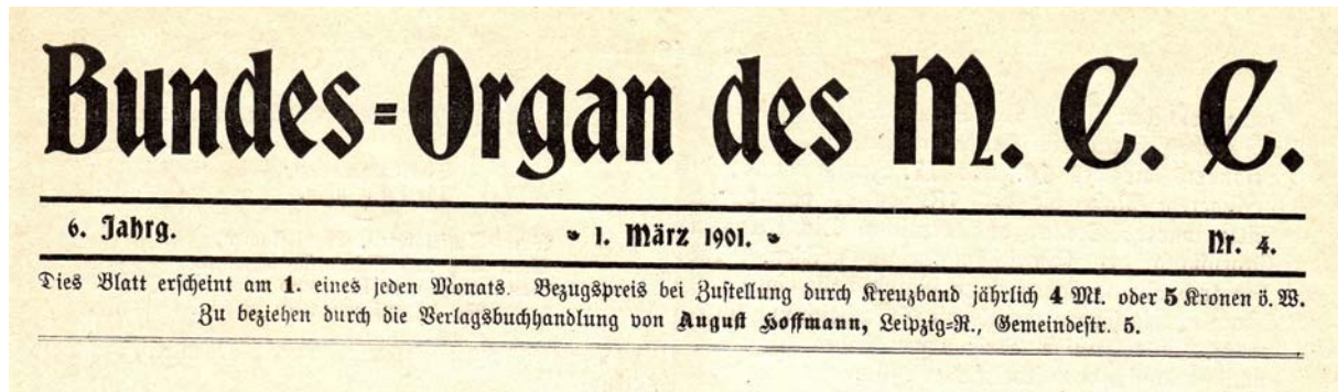
Abb. 4: Titelkopf nach der Umbenennung des Deutsch-Akademischen Sängerbunds (DASB) in Meißner Chargierten-Convent (MCC) mit gleichbleibender Jahrgangs- und Heftzählung, März 1901