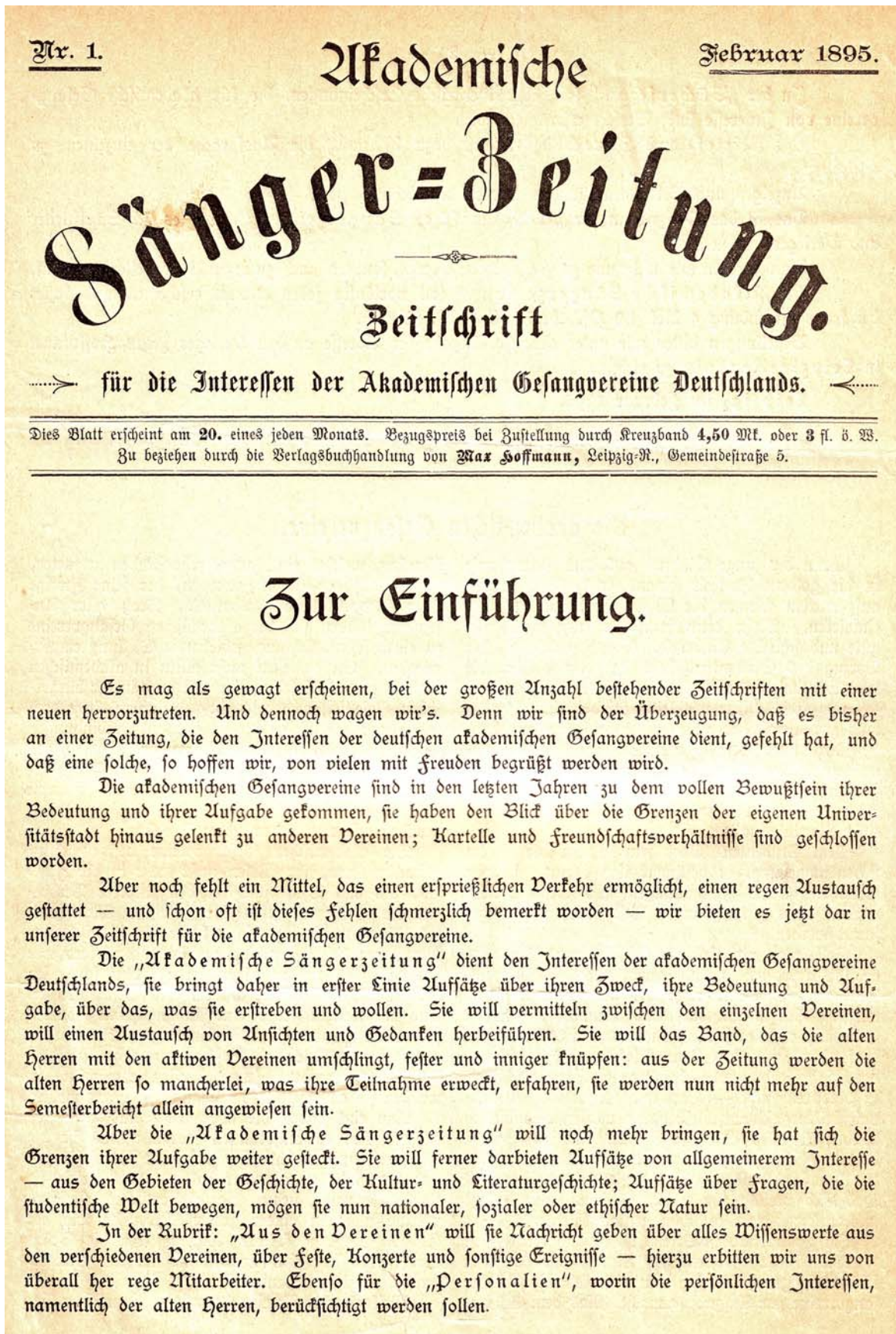
Abb. 1: Erste Seite der ersten Ausgabe der „Akademischen Sanger-Zeitung“, Februar 1895