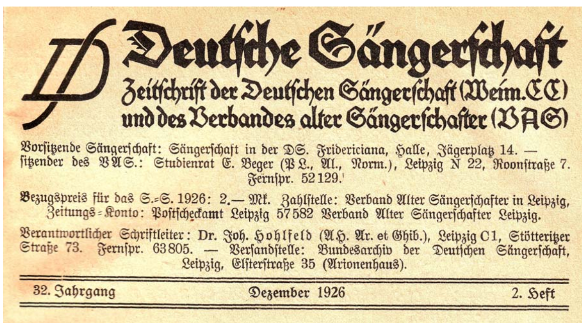
Abb. 18: Titelkopf der „Deutschen Sängerschaft“ seit Dezember 1926