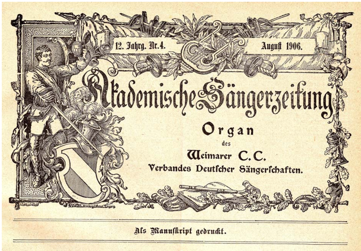
Abb. 8: Titelkopf der „Akademischen Sangerzeitung“ seit Annahme des Verbandsnamens Weimarer Chargierten-Convent, Verband Deutscher Sangerschaften (WCC) am 16. Juni 1906, August 1906