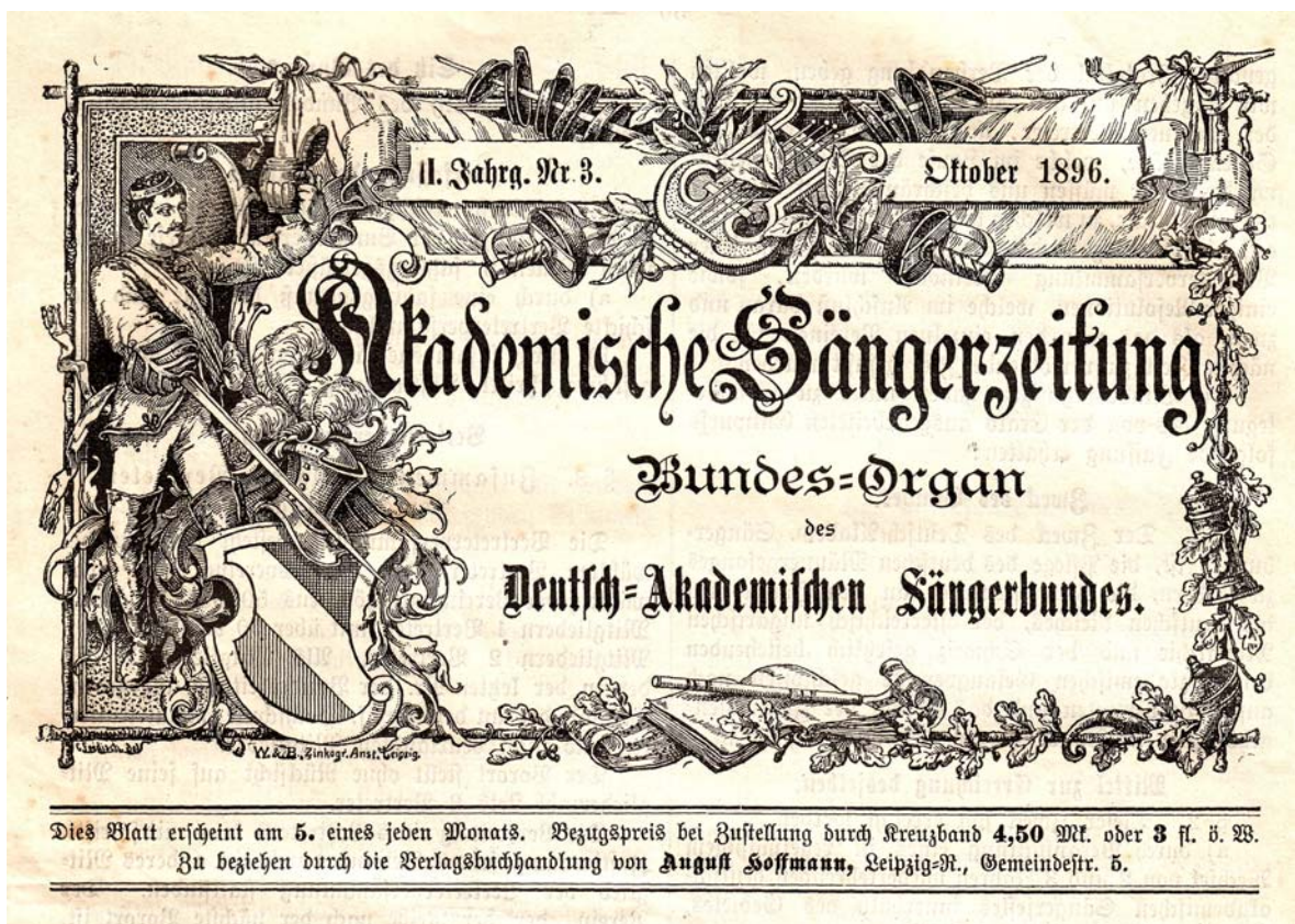
Abb. 3: Titelkopf der „Akademischen Sangerzeitung“ nach der Grundung des Deutsch-Akademischen Sangerbunds (DASB) am 5. Juli 1896, Oktober 1896