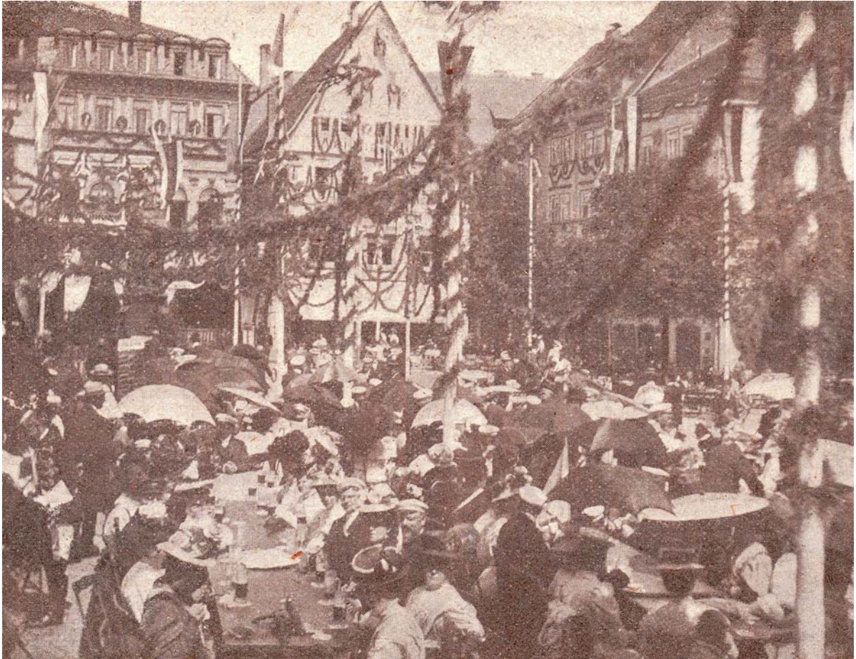
Abb. 9–12: Erstmals erscheinen aus Anlaß des 80. Stiftungsfests der Sängerschaft zu St. Pauli in Jena (30. Juli–1. August 1908) Bilder in der „ Akademischen Sängerschaft “ (Chargen des Rudelsburger Kartell-Verbands, Altherren-Bowle, Bummel, Festfrühstücken auf dem Marktplatz)