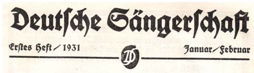
Abb. 19: Titelpage der „Deutschen Sängerschaft“ seit Januar 1931 bis zur Einstellung 1935