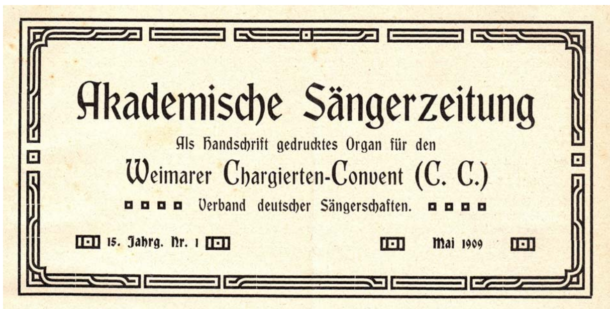
Abb. 13: Titelkopf der „ Akademischen Sängerschaft “ seit Mai 1909