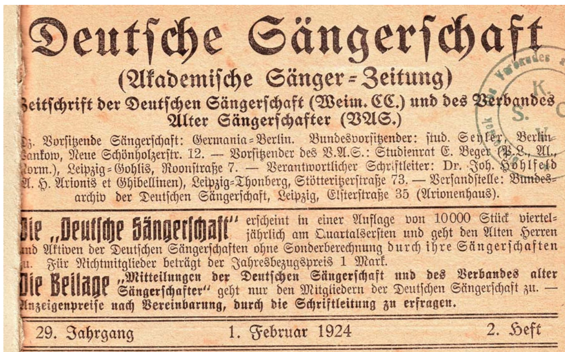
Abb. 17: Titelkopf der „Deutschen Sängerschaft (Akademische Sängerschaft-Zeitung)“ seit Februar 1924