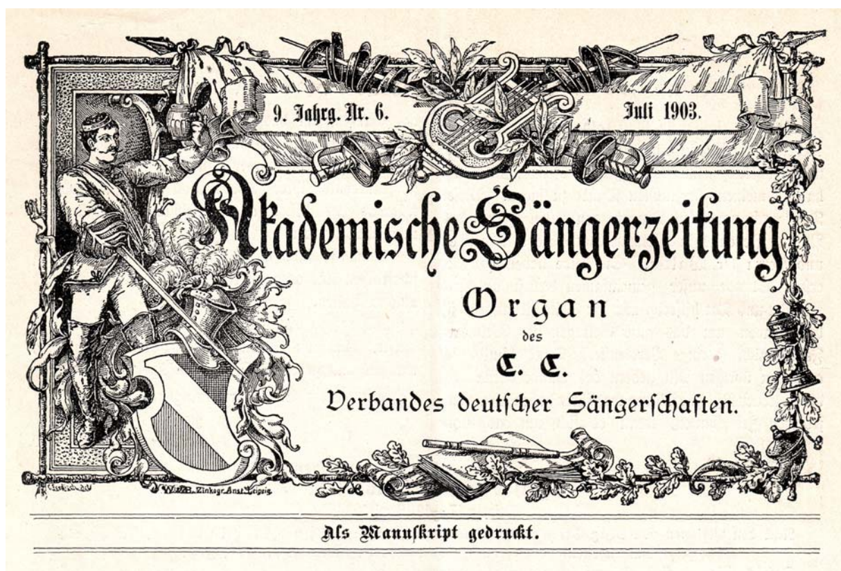
Abb. 7: Titelkopf der „Akademischen Sangerzeitung“ seit Annahme des Verbandsnamens Chargierten-Convent, Verband deutscher Sangerschaften (CC), Juli 1903