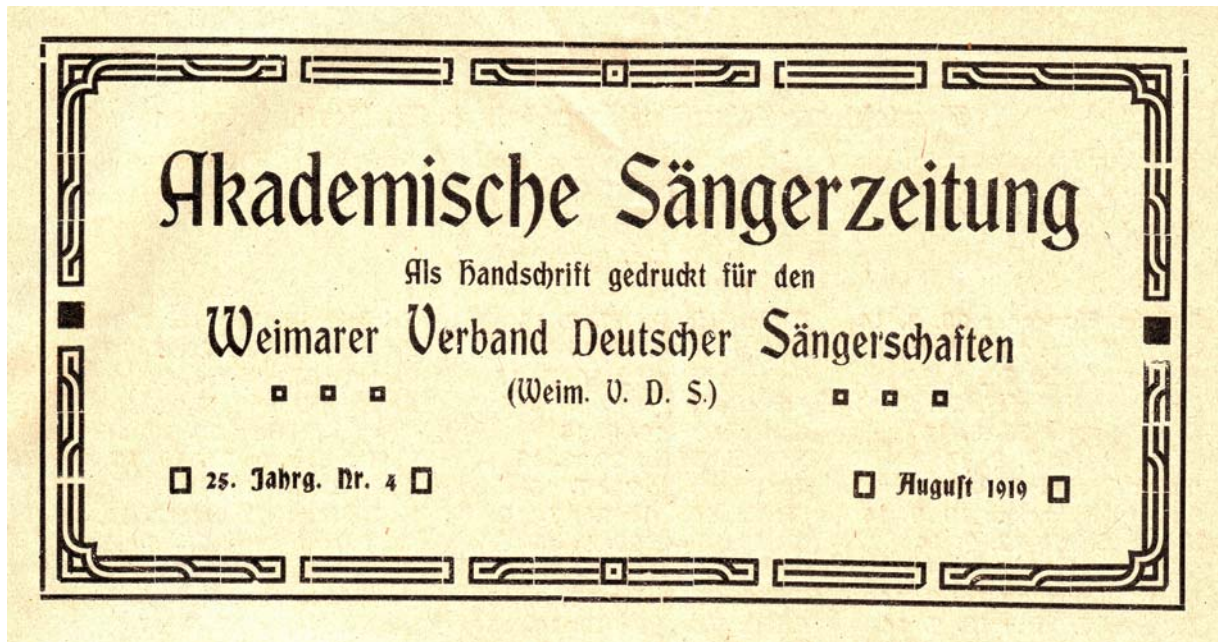
Abb. 15: Titelkopf der „Akademischen Sängerzeitung“ seit der Gründung des Weimarer Verbands Deutscher Sängerschaften (Weim. VDS) am 30. Juli 1919, August 1919