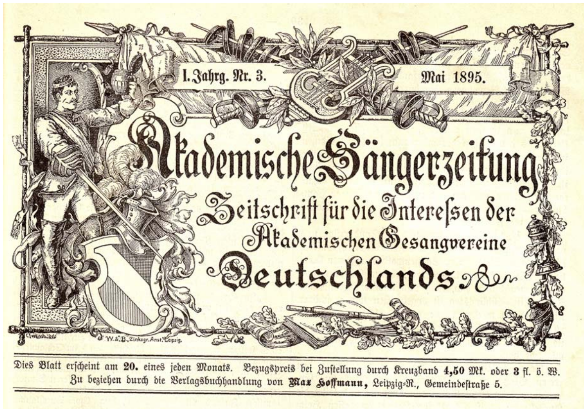
Abb. 2: Titelkopf der „Akademischen Sangerzeitung“ seit Mai 1895