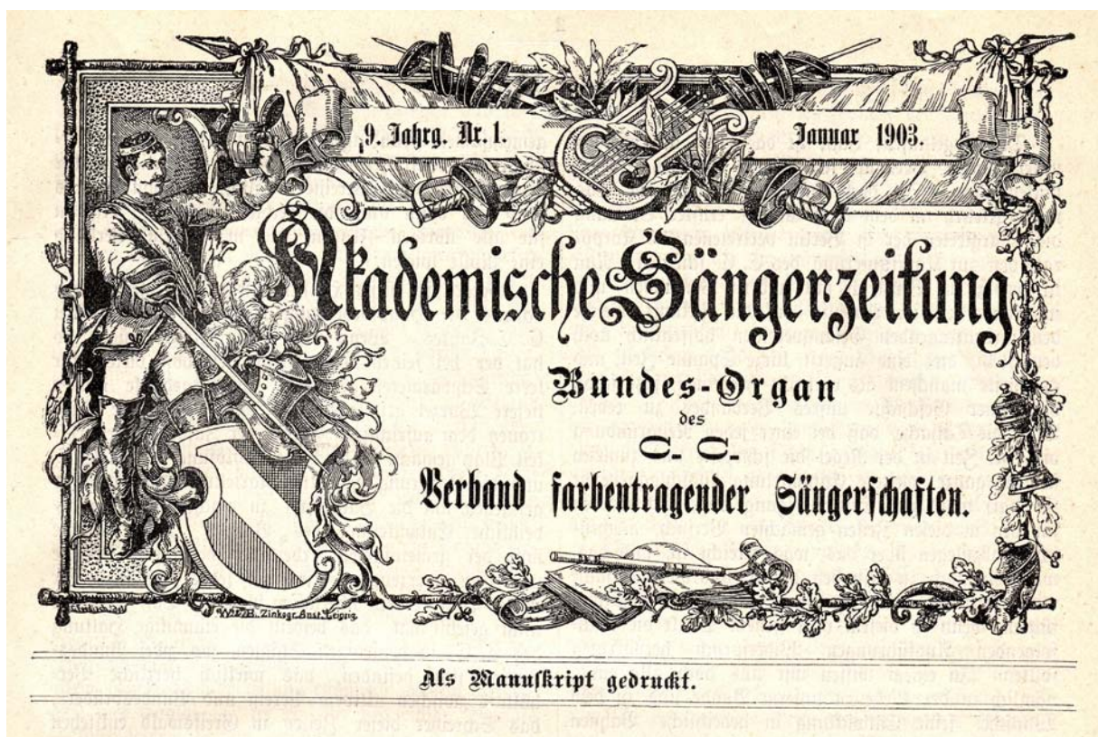
Abb. 5: Titelkopf der „Akademischen Sängerszeitung“ nach der Umbenennung des Meißner Chargierten-Convents (MCC) in Chargierten-Convent, Verband farbentragender Sängerschaften (CC) mit gleichbleibender Jahrgangs- und Heftzählung, Januar 1903