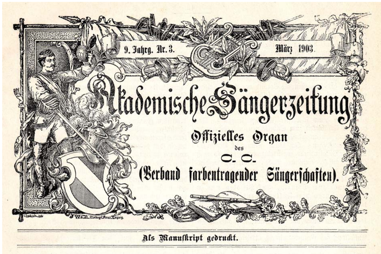
Abb. 6: Titelkopf der „Akademischen Sangerzeitung“ seit Marz 1903, „Verband farbentragender Sangerschaften“ in Klammern