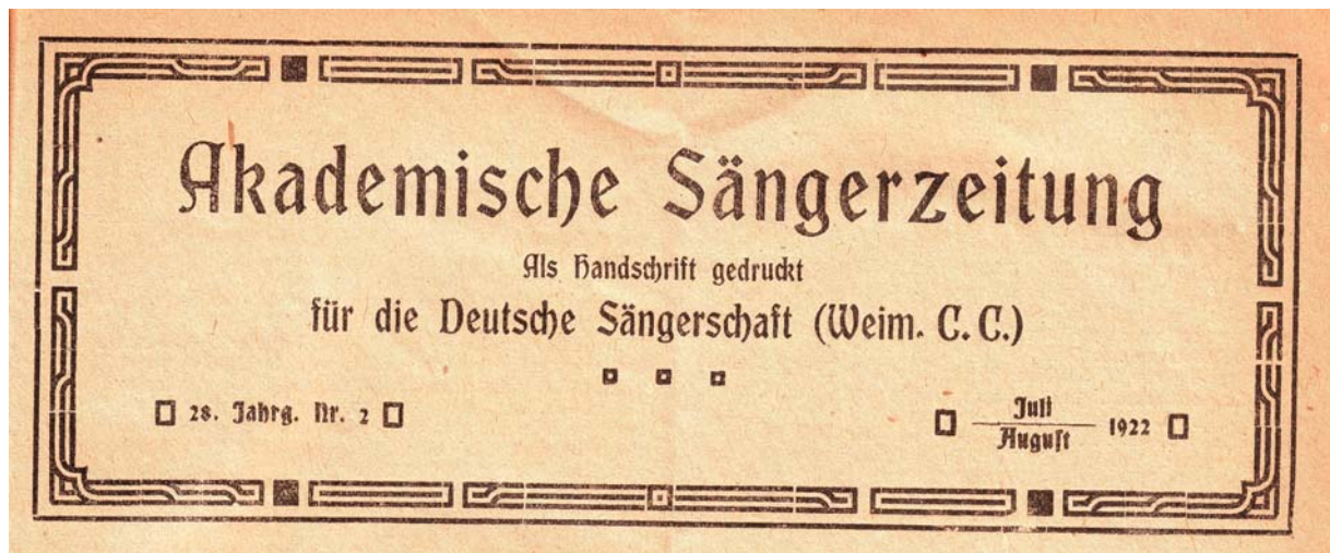
Abb. 16: Titelkopf der „Akademischen Sängerzeitung“ nach der Umbenennung des Weimarer Verbands Deutscher Sängerschaften (Weim. VDS) in Deutsche Sängerschaft, Weimarer Chargierten-Convent (WCC) am 10. Juni 1922, Juli/August 1922